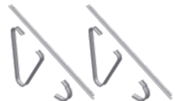
Bodenaufsteller-Set (SKW/BA) für Quermontage inkl. Backrails